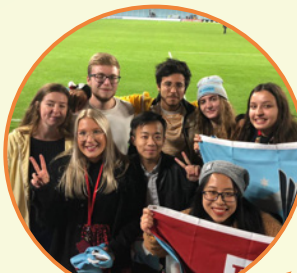
寒暑假海外院校交流