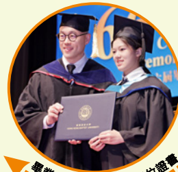
畢業生獲頒浸大學士學位證書